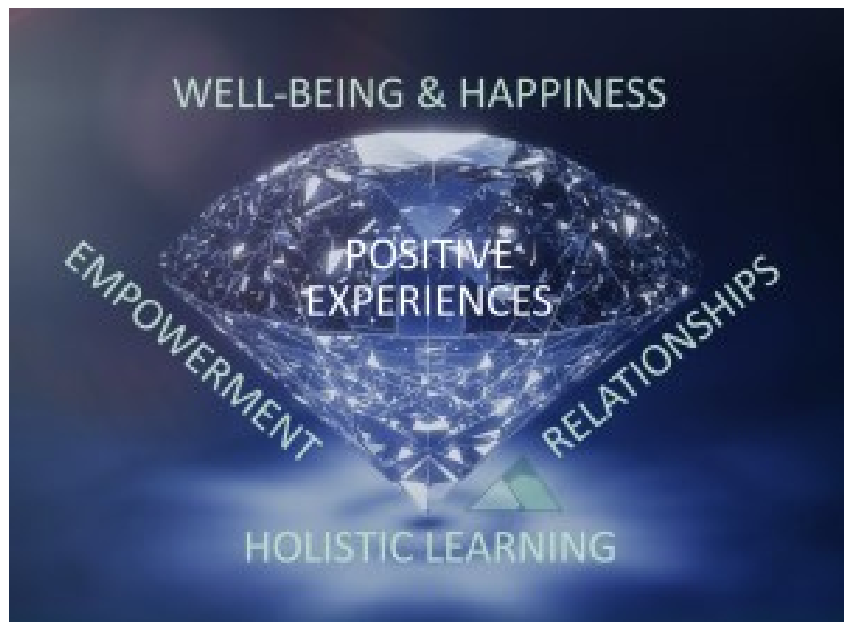
ThemPra's Diamond Model